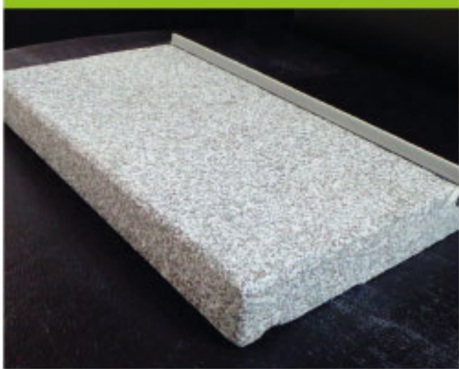
Tablettes de fenêtres en Granit