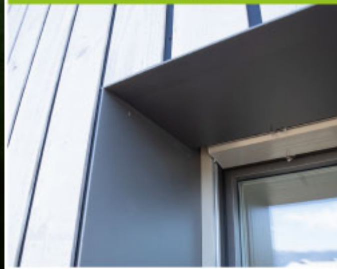
Encadrements de fenêtres en Aluminium